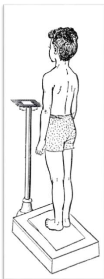
Рисунок 2 – Измерение массы тела ребенка

Измерение массы тела проводится в утренние часы до приема пищи, или не ранее чем через 3 часа после приёма пищи. Для измерения массы тела используют медицинские весы с точностью измерения до 100 гр (рисунок 2).