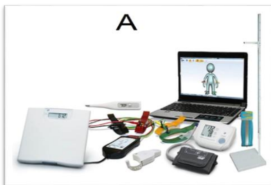
Рисунок 3 – АПК с компьютерной интеграцией данных

В современных условиях антропометрические измерения могут проводиться с помощью аппаратно-программных комплексов (АПК). В состав АПК входит комплект компьютеризированных приборов для измерения антропометрических и физиометрических параметров физического развития: весы, ростомер, кистевой динамометр, калипер. В настоящее время образовательные организации оснащаются АПК с частичной или полной компьютерной интеграцией результатов исследований в базу данных ЭВМ (рисунок 3).